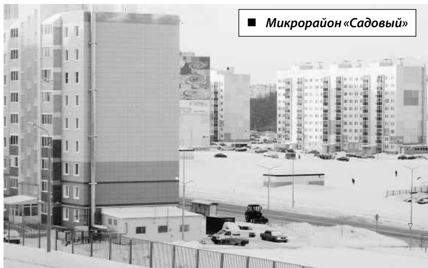
■ Микрорайон «Садовый»

Любой житель или организация города Чебоксары могут внести свое предложение по благоустройству общественных пространств, которое будет проведено в 2022—2023 годах в рамках национального проекта «Формирование комфортной городской среды».