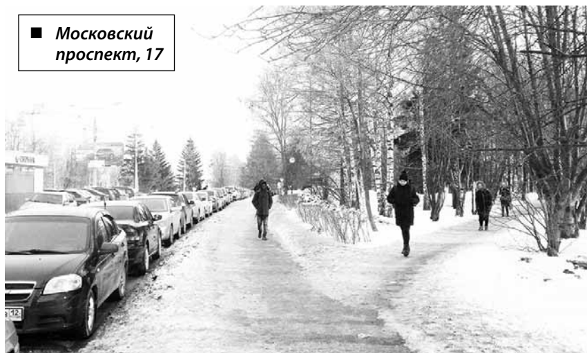
■ Московский проспект, 17

Заявки принимаются в районных администрациях до 15 февраля, затем их вынесут на рейтинговое голосование, которое пройдет с 1 по 15 марта. Проектровщики возьмут в работу шесть объектов (по два — от каждого района города), получивших наибольшую поддержку.