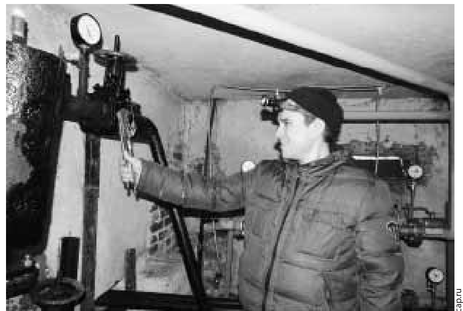
По улице Мичмана Павлова, 2 и 4 началась пусконаладка индивидуальных тепловых пунктов с автоматическим регулированием потребления тепла.

установка автоматизированной системы учета и регулирования потребления воды и тепла. Это позволит жителям 1378 многоквартирных домов экономить при расчетах за коммунальные услуги. В 20 многоквартирных домах смонтированы индивидуальные тепловые пункты.