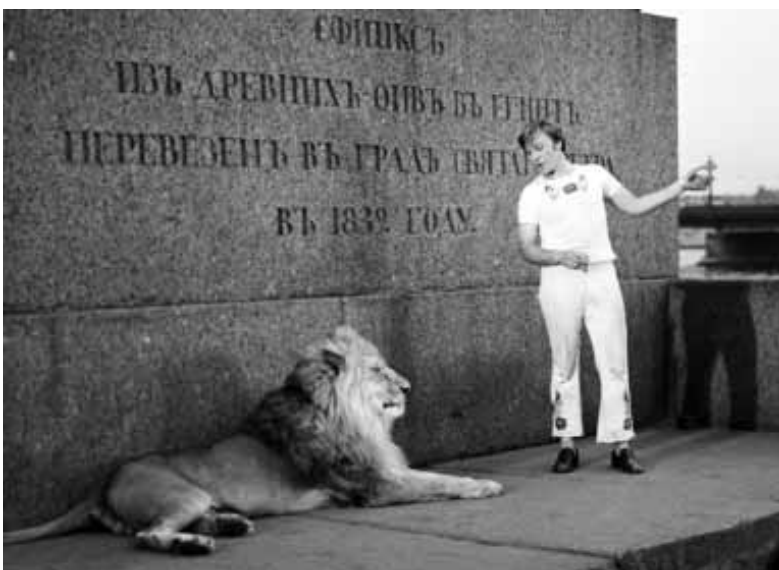
■ Кадр из фильма «Невероятные приключения итальянцев в России»

Проект продолжает свою работу, рассказали в отделе литературы по искусству. Показы фильмов стараются приурочить к памятным датам и праздникам. К примеру, к дню рождения народного артиста РСФСР Андрея Миронова чебоксарские зрители увидят эксцентричную комедию «Невероятные приключения итальянцев в России». В марте также покажем лирическую комедию «Одиноким предоставляется общежитие», киноновеллы по произведениям Михаила Зощенко «Не может быть!», кинокомедию «Женитьба Бальзамина» по мотивам трилогии А.Н. Островского и другие.